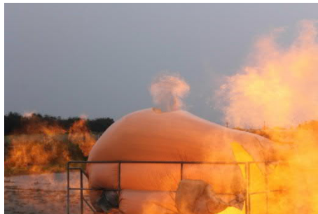
Simulation einer Gasverpuffung

„Toi, toi, toi. Bisher ist mir so etwas noch nicht passiert. Aber gut zu wissen, was wäre wenn ...“