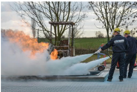
Baggerzugriff auf Mitteldruckleitung